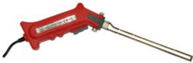
Styro Cutter Z190