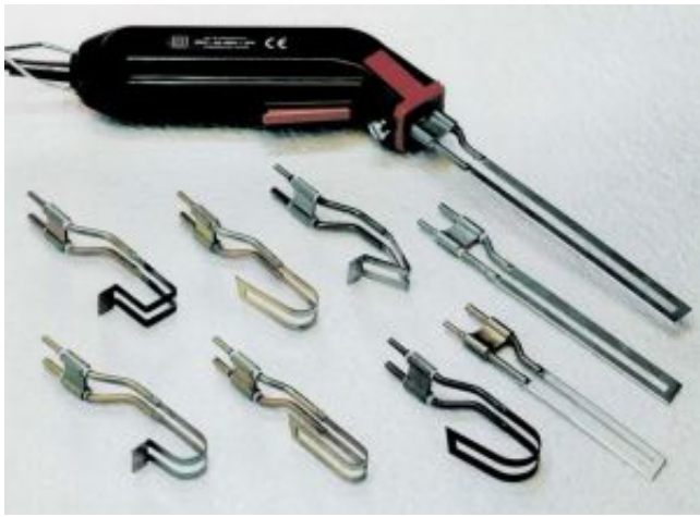
Styro Cutter Z140