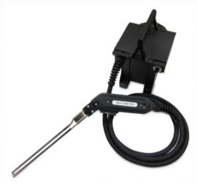
_ Styro Cutter Profi